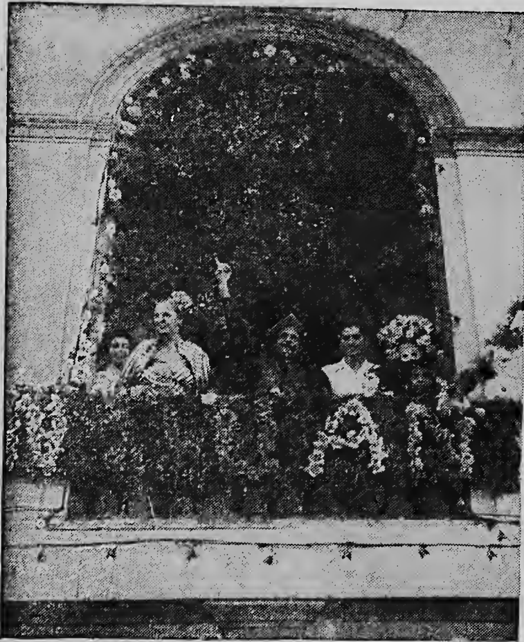
NOG EEN TWEETAL foto's van de herdenking van de Leon in Puerto Rico. De Conquistador was voor deze gelegenheid nogmaals op Puerto Rico teruggekeerd en werd daar met grote onderscheiding behandeld. Gouverneur Luis Munez Marin ontving de hoge gast persoonlijk en vanaf het balkon van het stadhuis sprak de Leon de menigte toe waarbij hij aan het grote verleden, waarop het hedendaagse Pto Rico kan voortbouwen wees. Later was hij de gast van de Gouverneur en logeerde hij (een nacht) op het Pto Ricijnse Witte Huis.